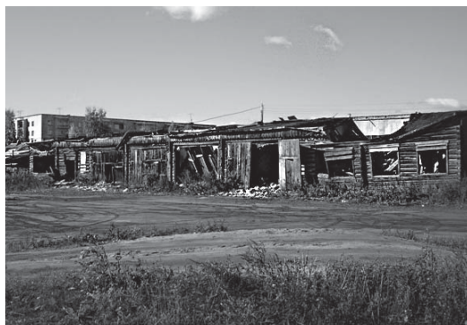
Рисунок 1. Списать