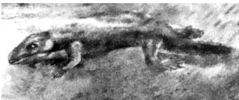
Якубсония ливенская в естественной среде обитания. Реконструкция О.А. Лебедева, художник — В.Д. Колганов.

Это открытие палеонтологов позволяет с уверенностью утверждать, что первые наземные животные появились в Европейской части России на территории Орловской области вблизи г. Ливны. Теперь можно смело заявить — впервые четвероногие, которые обитали на Земле более 350 миллионов лет назад, вышли на сушу именно недалеко от г. Ливны.